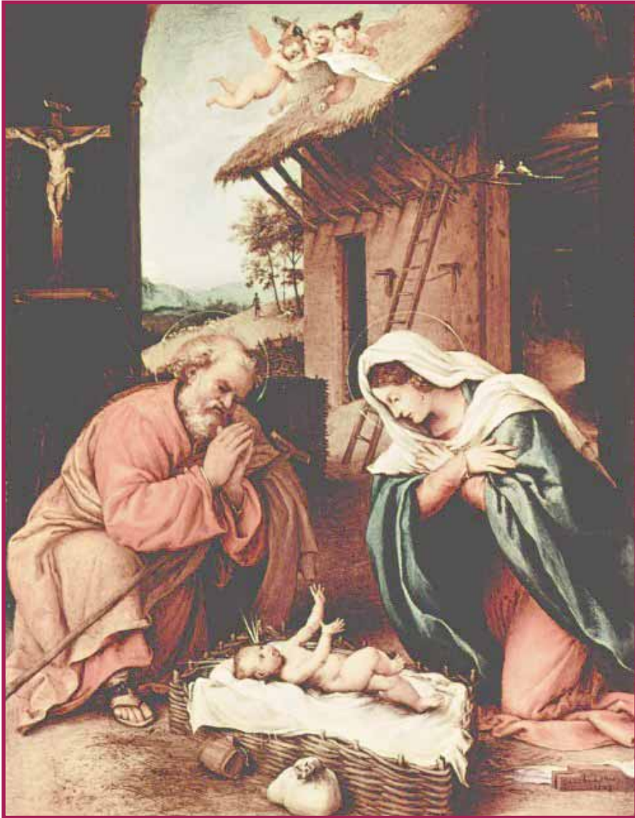
Da Le dieci natività più belle della storia dell'arte - Liberiamo - Lorenzo Lotto - La natività - 1523

Bollettino della comunità parrocchiale di Morbio Inferiore